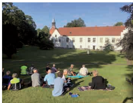
Parken bag Dalum kloster.

Så gik turen over på den anden side af vejen til den lille klosterkirke ved Dalum kloster. Dalum kloster er den tidligere hovedgård Kristiansdal og altså ikke det oprindelige kloster. Kirken, en lille katolsk kirke, bliver brugt af Skt. Hedvigsstrengene, der bor på klosteret. De er 3 tilbage, og der er 10 faste beboere. Kirken er 100 år gammel.