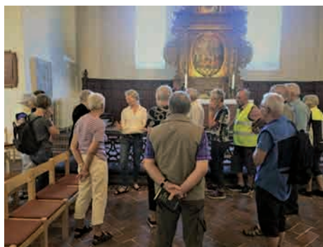
Alterpartiet i Dalum kirke.

Der er via Iver Vind forbindelse mellem Dalum kirke og Sdr. Nærá kirke. Lensmand Iver Vind (på Sanderumgård og Torpegård) fik i 1646 tilladelse til af Chr. IV at benytte venstre korsarm til gravkapel mod at betale for kirkens restaure-