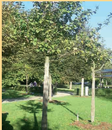
Det fynske Ingrid Marie æbletræ i Wittenberg

Juniorkoret, som i denne sæson har omkring 50 sangere, medvir-