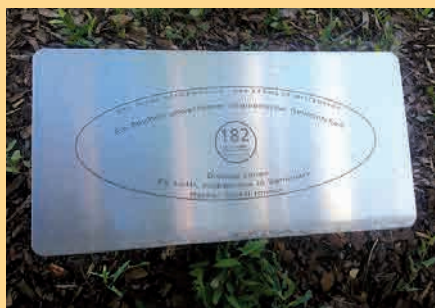
– med tilhørende plade.

I forbindelse med reformationsjubilæet har Stiftet som stiftsbegivenhed opfordret til, at der i alle sogne plantes et træ, gerne et Ingrid Marie æbletræ, som søstertræ til Fyens Stifts Ingrid Marie æbletræ i Lutherhaven, Wittenberg. Vi har i Menighedsrådet besluttet, at vi vil følge opfordringen og ved familiegudstjenesten plante et sådant træ et sted på kirkegården.