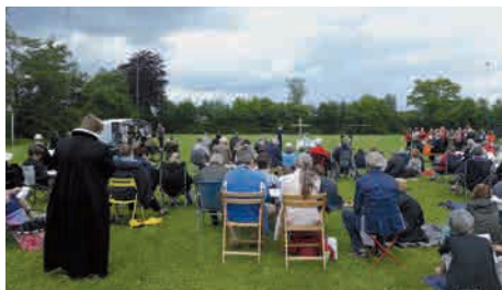
Fra friluftsgudstjenesten 5.6.2017 i Herringe.

Hele Midtfnys Provsti inviteres til friluftsgudstjeneste i Bakkelunden,