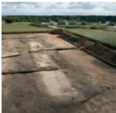
Stendysse ved Ibjergrøden.

Ærkeenglen Mikael er ifølge Daniels bog englens anfører, klar til at nedkæmpe onde kræfter i form af drager. Men Mikael er også den barmhjertige sjælevej, der på dom-