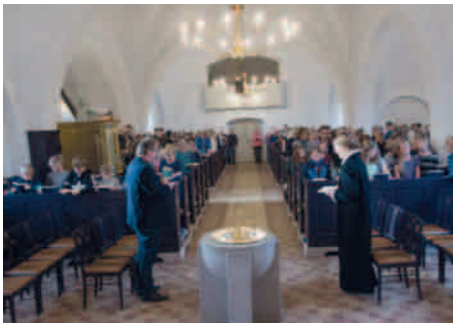
Sikken dejlig dag!