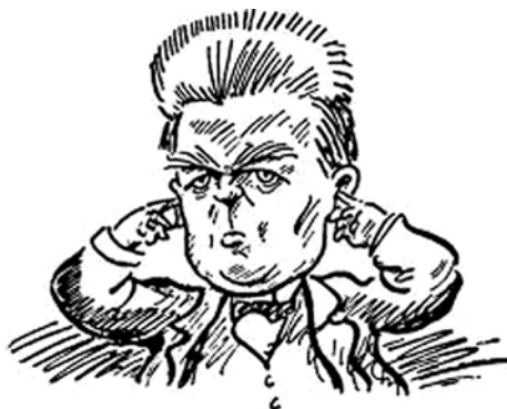
Det vil jeg ikke høre på.