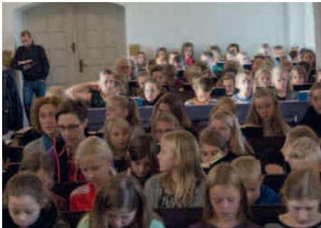
Der synges af lærere og elever fra BRO-skolen og Friskolen.