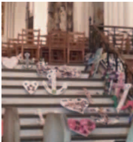
Tro, håb og kærlighed i Domkirken.

at politiets arbejde ligger i forlængelse af evangeliet om tro, håb og kærlighed, at der skal værnes om den svage part, for vi skal alle kunne færdes lige og frit.