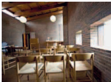
Kjellerupkirken fra 1976.

To af menighedsrådets medlemmer tilbød venligt at køre for os. Efter at have afleveret tasker og mobiltelefoner blev vi ført op til kirken og hørte om, hvorfor der er kirke i et fængsel. Ringe Statsfængsel er det eneste lukkede ungdomsfængsel for unge mænd, og de indsatte kan sidde til de er 26, højst 28 år. Vi talte med to indsatte, som fortalte åbent om deres baggrund og hvorfor de var havnet der. Den ene, en ung mand